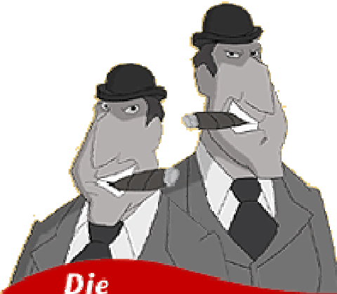
Die grauen Herren